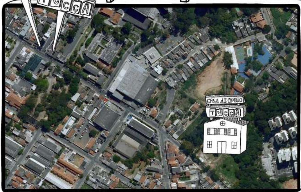
Foto do terreno